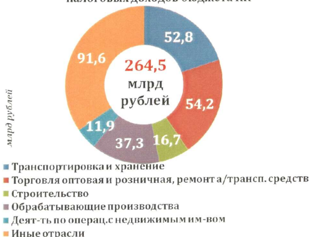
Отрасли, обеспечивающие основной объем налоговых доходов бюджета КК

проф.доход, госпошлине, платежам при пользовании природными ресурсами, доходам от продажи активов.